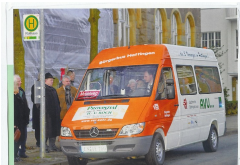
Start zur ersten Fahrt am 01. Februar 2005 ab Rathaus.

Aktuell verläuft die Fahrtroute vom Homberg zur Lindenstraße mit zentralen Haltestellen am Rathaus und am ZOB.