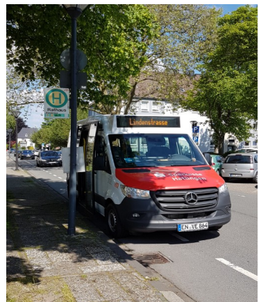
Unser aktueller Bus – Abfahrt vom Rathaus zur Lindenstraße