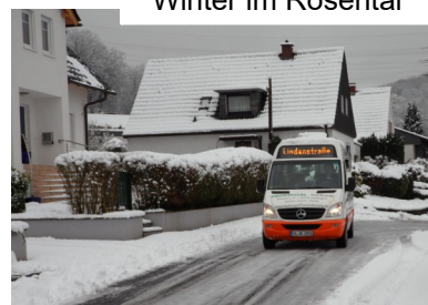
Winter im Rosental