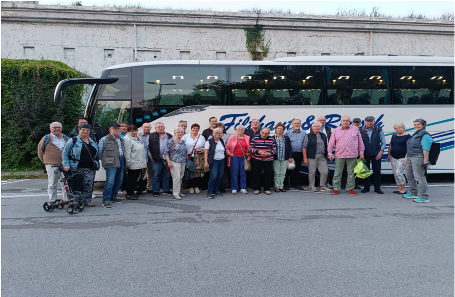
Ausflug nach Giethoorn – Sommer 2023