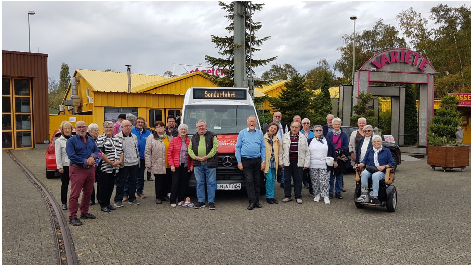
Im Variété - Sommer 2022

Einmal jährlich machen die Fahrerinnen und Fahrer mit ihren Partnerinnen und Partnern einen gemeinsamen Ausflug. Am ersten Advent findet ein gemeinsames Weihnachtsessen statt.