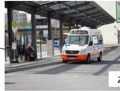
ZOB - Reschopcenter