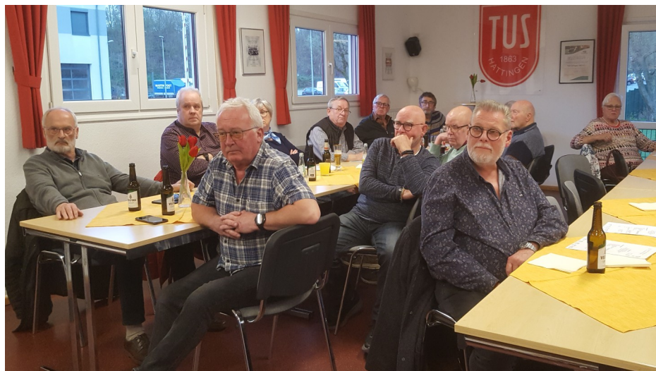
Jahreshauptversammlung im Vereinsheim des TUS Hattingen im März 2024